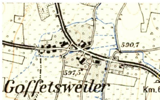
Bild 1: Auszug aus GIS - Topkarten von 1960 mit Darstellung der damaligen Gewässerläufe

Weiter sollte der verdolte Gewässerlauf von einer weitergehenden Überbauung freigehalten werden, um zukünftig notwendige Wartungen an der bestehenden Verdolung zu gewährleisten und Schäden (z.B. Sackungen und Quetschungen) an ebendieser durch Bautätigkeiten zu vermeiden.